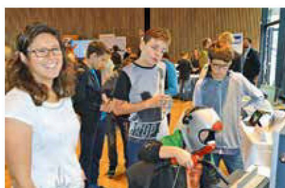
Bei der Firma Sonnleitner konnten die Schüler*innen gleich Hand anlegen.