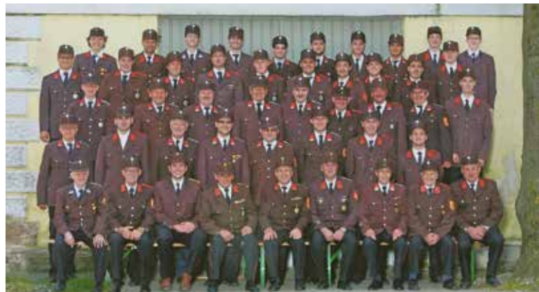
Die Mannschaft der Feuerwehr Mechters.

Der Mitgliederstand beträgt 64 Mitglieder, davon gehören 45 der Aktivmannschaft, 6 der