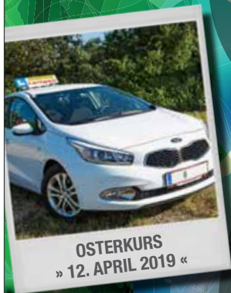
OSTERKURS » 12. APRIL 2019 «

ANMELDUNG in deiner Fahrschule ING. LEITGEB