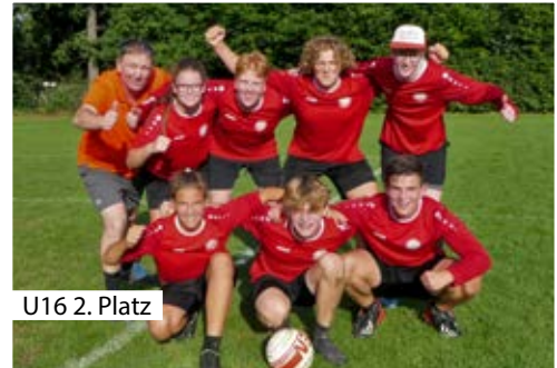
U16 2. Platz