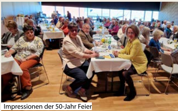
Impressionen der 50-Jahr Feier