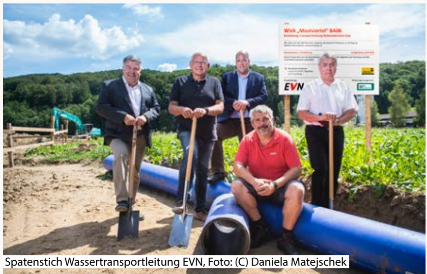
Spatenstich Wassertransportleitung EVN

Viele kleine Baustellen und Sanierungen wurden daher gegen Jahresende verschoben, andere können erst nächstes Jahr in Angriff genommen werden.