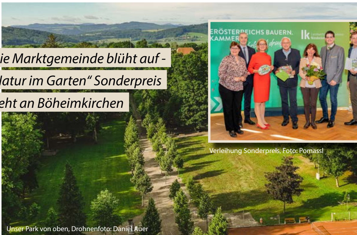
Unser Park von oben