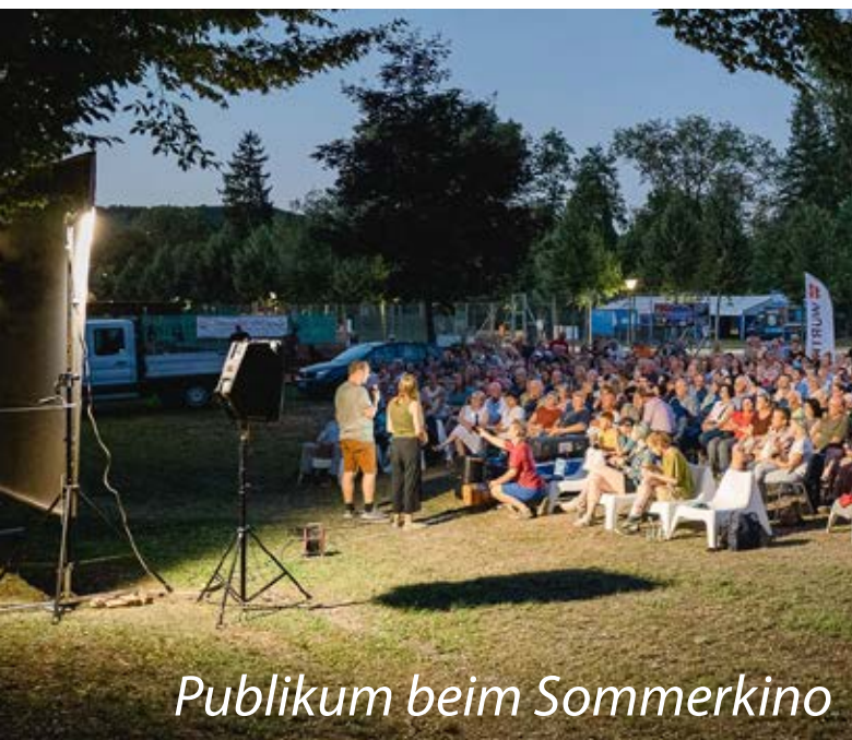
Publikum beim Sommerkino