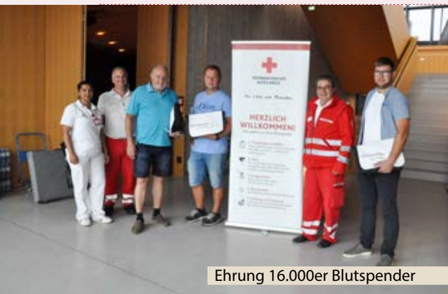
Ehrung 16.000er Blutspender