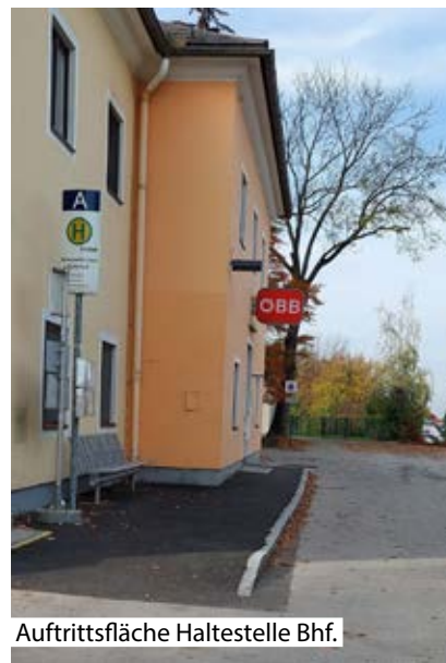
Auftrittsfläche Haltestelle Bhf.