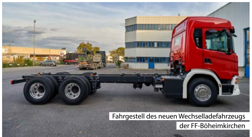
Fahrgestell des neuen Wechselladefahrzeugs der FF-Böheimkirchen

Für den Finanz- und Raumordnungsausschuss Vzbgm. Franz Gugerell