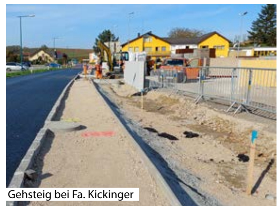
Gehsteig bei Fa. Kickinger

Bei einigen bereits geplanten Straßenbauvorhaben , wie z.B. jenes in der Dr. Adamitschgasse , wo eine durchgehend neue Asphaltdecke vorgesehen war, wurde die Fertigstellung auf nächstes Jahr verschoben , da noch eine ungeplante Sanierung der Wasserleitung notwendig wurde.