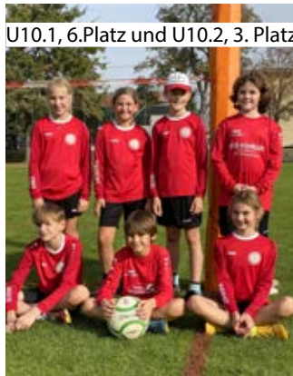
U10.1, 6. Platz und U10.2, 3. Platz

„Wir begrüßen unsere Trainer, Spieler, Gegner und unsere Fans mit einem lauten Faust-Ball!“