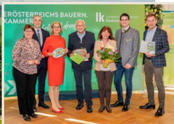
Verleihung Sonderpreis

Die Aktion „Blühendes NÖ“ fand heuer bereits zum 54. Mal statt. Dieses Mal hatten 81 Gemeinden Projekte eingereicht. Die Preisverleihung fand am 4. Oktober 2022 im Rahmen einer feierlichen Auszeichnungsveranstaltung in der LK NÖ mit einer Festansprache von Landeshauptfrau Johanna Mikl-Leitner statt: