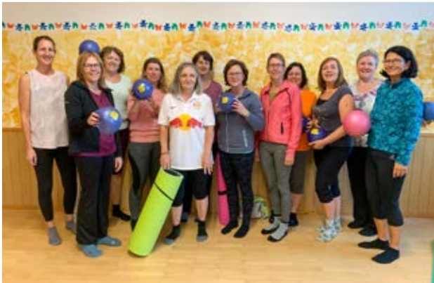
Pilatesgruppen Montag (oben) und Freitag (unten)