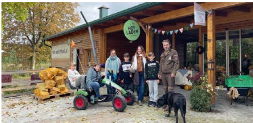
Vor dem Hofladen mit Kindern der STB Böheimkirchen: