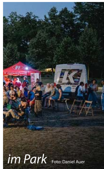
im Park