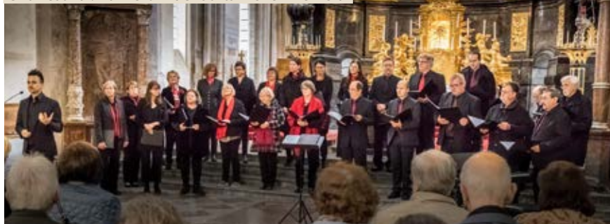
Chorfestival: Konzert in der Stiftskirche Lilienfeld

Übrigens: die Probenstunde steht allen Gesangsinteressierten offen! Geprobt wird jeden Montag von 19:30 bis 21:15.