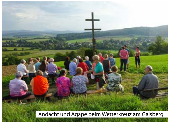
Andacht und Agape beim Wetterkreuz am Gaisberg