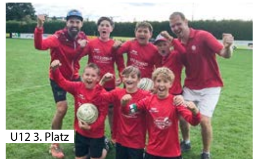
U12 3. Platz