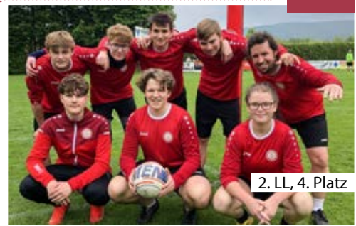
2. LL, 4. Platz