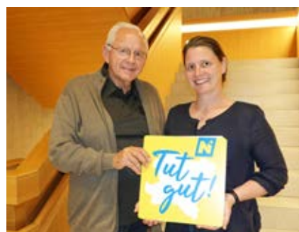
▲ Gruppenfoto Wandererwachen