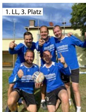
1. LL, 3. Platz