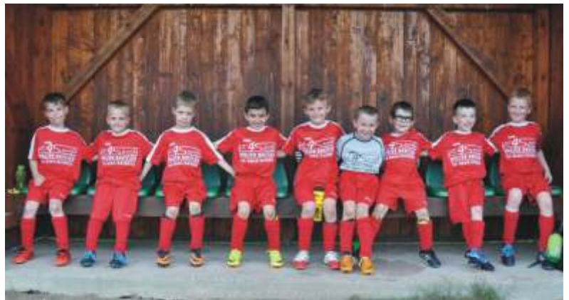
Unsere jüngsten SVB Player = die U7