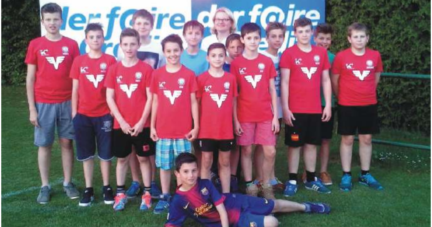
Höchster Sieg im Frühjahr der U13 = ein 17:0 gegen NSG St.Georgen/Steinfeld