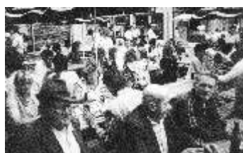
Marktfest Autobahneröffnung 1988