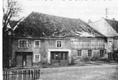
Altes Winterhaus (Bäckerei) - Foto 1949