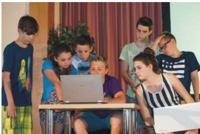
Theaterpremiere "Böheimkirchen vor langer Zeit"

Böheimkirchen ist nicht nur Wirtschaftsstandort, sondern auch Wohlfühlort für Unternehmer