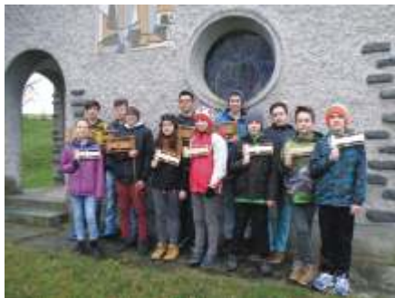
12 Ratschenkinder waren in der Karwoche in Weisching von Haus zu Haus unterwegs. Danke den fleißigen „Ratschern“.

■ Text u. Fotos: Franz & Maria Schmatz, Weisching