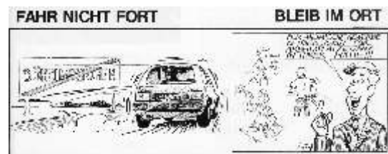
Schaltung im Jahr der Autobahneröffnung 1988