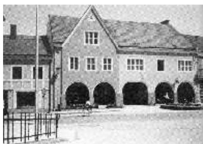
Danach entstand das heutige "Plattner-Haus"