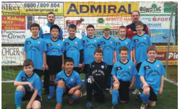
U11 mit neuen Dressen vom Pizza Kebab Treff aus Böheimkirchen