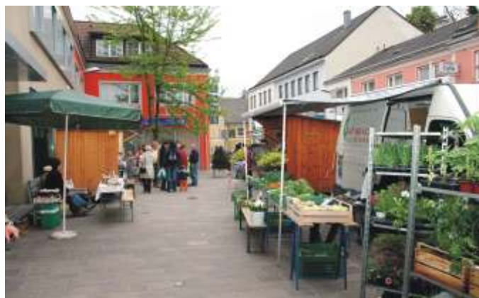
Wöchentlicher Böheimkirchner Bauernmarkt am Marktplatz

Der Bauernmarkt von Böheimkirchen hat heuer sein 14-jähriges Bestehen. Dieser wird von den Marktstandler in Kooperation Ortsmarketingverein FÜR BÖHIEMKIRCHEN gemeinsam organisiert.