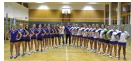
Platz 3 in der Endtabelle der 2. Landesliga für unsere Damen-Mannschaft