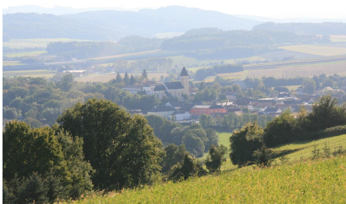
Aussicht auf Böheimkirchen vom Kronberg