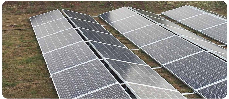
Begrüntes Dach mit PV-Anlage

logischen Dämmmaterialien aus nachwachsenden Rohstoffen.