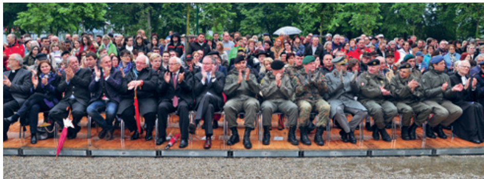
Zahlreiche Ehrengäste und Publikum versammelt im Park