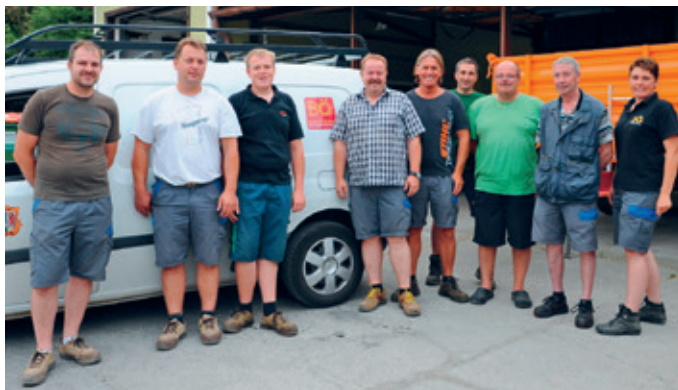
Das Bauhof-Team der Gemeinde.

Für die Bewohnerinnen und Bewohner der Marktgemeinde bietet der Bauhof umfangreiches Service: Es umfasst die Betreuung der Wasserversorgung, die Abwasserbeseitigung, die Instandhaltung der gemeindeeigenen Liegenschaften, der Friedhöfe und des Freibades, die Übernahme von Sperr- und Sondermüll sowie von Grünschnitt und Kartonagen, aber auch die Grünraumbewirtschaftung. Derzeit sind insgesamt 9 Mitarbeiter für die Bürgerinnen und Bürger im Einsatz.