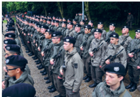
Die Rekruten bei der Angelobung.