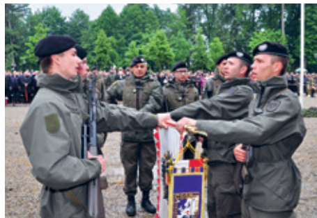
Der feierliche Eid.

In Anwesenheit von Repräsentanten der Republik Österreich und des Landes Niederösterreich sowie im Beisein vieler Bürgerinnen und Bürger der Marktgemeinde Böhheimkirchen wurden am 22. Mai 250 Rekruten aus den Kasernen Mautern und Längenlebern im Rahmen eines Festaktes feierlich angelobt.