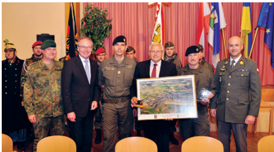
Festlicher Abschluß bei Empfang im Festsaal