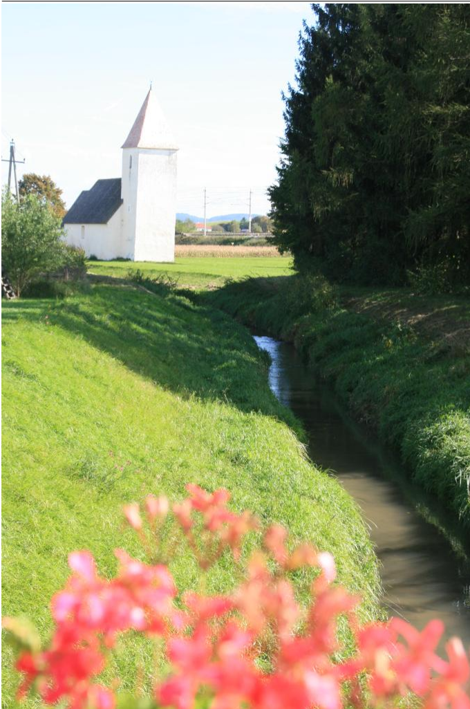
Eichenbergweg mit Blick auf die Kirche Lanzendorf