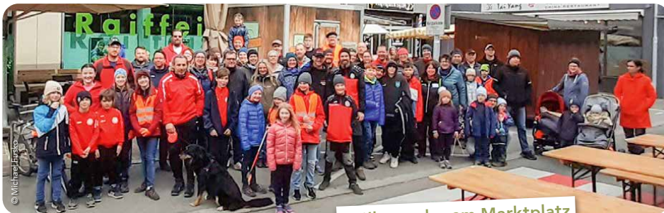
Müllsammler am Marktplatz

Den Abschluss und gemütlichen Ausklang bildete ein verdienter Imbiss beim Bauernmarkt am Marktplatz. In den Katastralen wurden eigene „Putztage“ der Dorfgemeinschaften veranstaltet. Herzlichen Dank dafür!