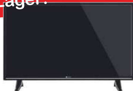
Nabo 32" LED Fernseher