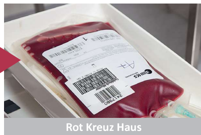
Rot Kreuz Haus