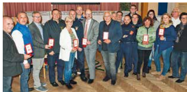
Die Niederösterreichische Zivilschutzverband - Stabschulung in Böheimkirchen war ein voller Erfolg.

In seiner Ansprache unterstrich der Bürgermeister die Notwendigkeit und Wichtigkeit dieser Schulung, die den Mitgliedern der Gemeinde-einsatzleitung das Rüstzeug für den Ernstfall geben soll.