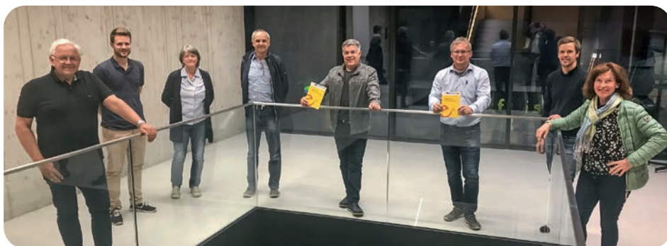
neues e5 Team Böheimkirchen

Programm des Landes NÖ teil, welches das Ziel verfolgt, Energie- und Klimamaßnahmen in der Gemeinde zu forcieren und umzusetzen. Mit Expertenunterstützung von Fachleuten der Energie- und Umweltagentur (eNu) erfolgte die Weichenstellung in 6 verschiedenen Handlungsfeldern (Entwicklung und Raumordnung, Kommunale Gebäude und Anlagen, Versorgung und Entsorgung, Mobilität, interne Organisation, Bewusstseinsbildung und Kommunikation). Als Leuchtturmprojekt kann die 2019 errichtete „Sonnenschule“, eine 21 KWp Photovoltaik-Anlage für die Volks- und Mittelschule, die nachweislich bereits im ersten Jahr zu bedeutenden