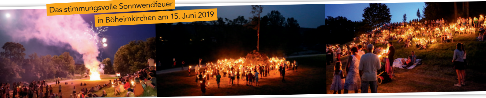
Das stimmungsvolle Sonnwendfeuer in Böheimkirchen am 15. Juni 2019