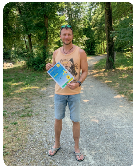
Alle 3 Schrittwegen starten im Park. Für Kids gibts spannende Rätsel-Aufgaben